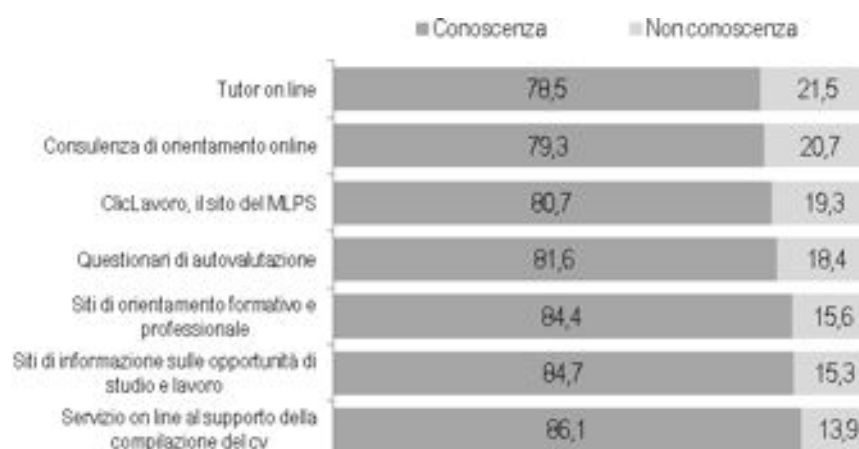
Grafico 4.1 – Conoscenza dei servizi di orientamento on-line popolazione attiva (% sul totale degli intervistati)

grafico 4.1 mostra come gli intervistati contattati per la rilevazione sulla popolazione attiva abbiano una conoscenza elevata dei servizi considerati dall'indagine.